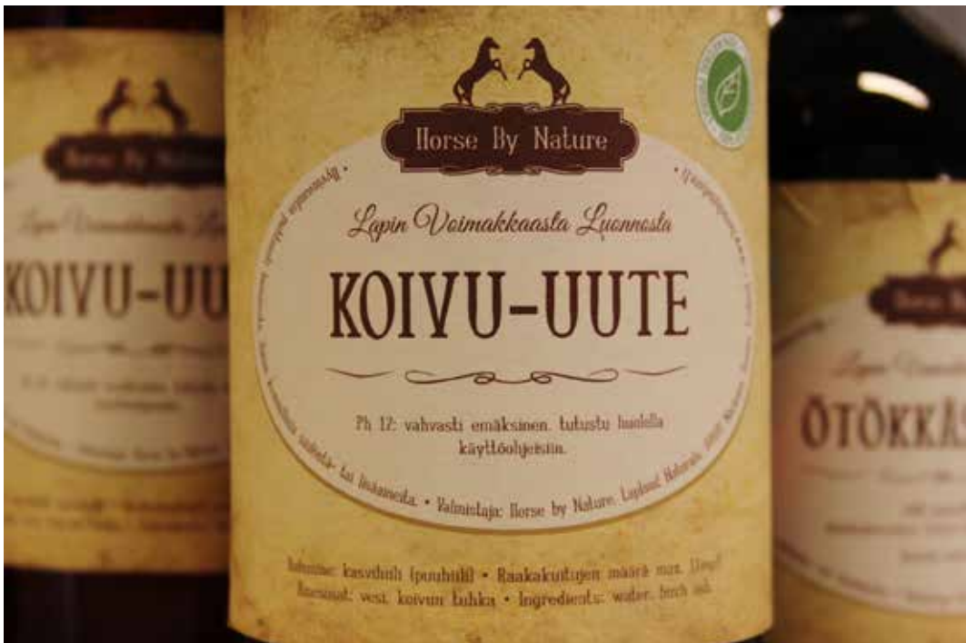
Kuva 6. Koivun tuhkaute sopii hyvinvoinnin edistämiseen sekä ihmisillä että eläimillä

Lemmikkien asema ihmisten arjessa on muuttunut ja niiden merkitys ihmisille on voimistunut. Lemmikkejä pidetään usein lähes perheenjäseninä ja niitä halutaan hemmotella ja hoitaa kuten muutakin perhettä. Esimerkiksi harrastustoiminta