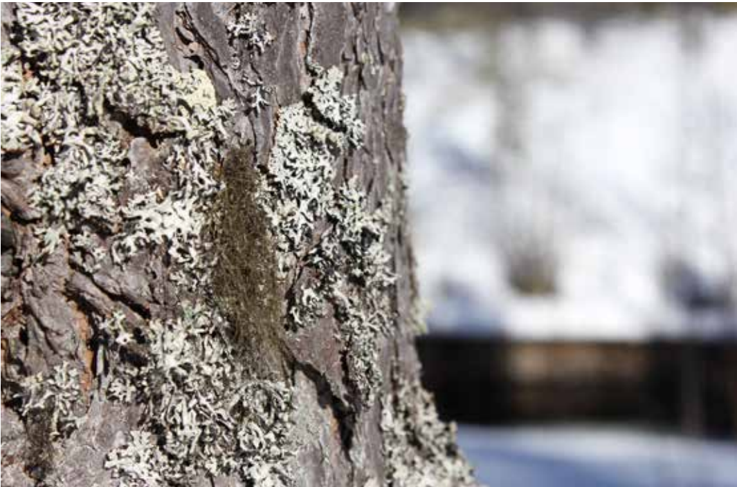
Kuva 5. Sormipaisukarve on Suomessa yleinen ja runsas lehtijäkälä, jota voidaan hyödyntää jäkälävärjäyksessä. Myös lupot sopivat värjäyskäyttöön.

Jäkälävärjäyksessä on käytössä kolme eri värjäys- tekniikkaa: keittomenetelmä, ammoniakkimenetelmä sekä foto-oksidimenetelmä. Keittomenetelmään sopivia jäkäliä ovat mm. isohirvenjäkäliä ( Cetraria islandica ), huopanahkäjäkäliä ( Peltigera canina ), torvijäkälät ( Cladonia ), poronjäkäliä ( Cladina ), sormipaisukarve ( Hypogymnia physodes ), valkohankajäkälä ( Evernia prunasfri ) sekä tumma- ja viherlupot ( Alectoria ja Bryoria ). Keittomenetelmällä jäkälistä saadaan keltaisen ja ruskean sävyjä. Ammoniakkimenetelmällä saadaan risa-