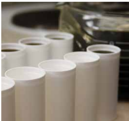
Kuva 8. Yrteistä valmistettävien hoitovoiteiden valmistus vaatii paljon käsiyötä

eivät rajoitu pelkästään pajun punontaan, vaan niissä hyödynnetään myös yrityksen muita tuotteita eli metsästä kerättäviä floristiikan raaka-aineita kuten sammalta, varpuja ja havuja. Sunniemen pajutilalta saa lisäksi neuvontaa ja opastusta elävien pajutöiden suunnitteluun. (Sunniemen pajutila 2013, hakupäivä 30.11.2013; Syvälahden pajutila, hakupäivä 9.1.2014.)