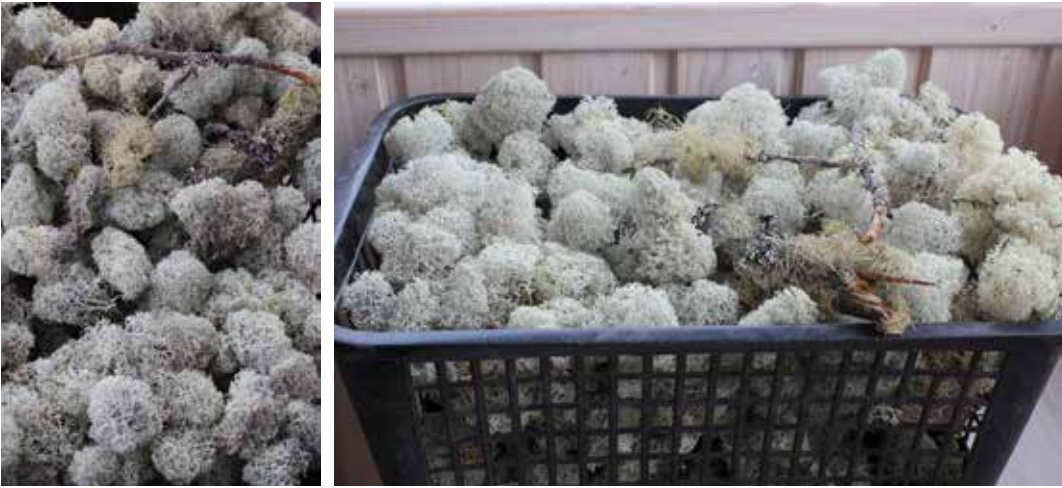
Kuva 2. Palleroporonjäkäälä on floristiikassa yleinen raaka-aine

lu- ja somistustarkoituksiin värjättyä jäkälää, jäkäläseppeleitä sekä esimerkiksi jäkäläoksia, jäkälänauhoja, jäkälätupsuja sekä kuorittuja käpyjä. (Fonecta Oy 2013, hakupäivä 28.11.2013; Lehto-Isokoski 2008, hakupäivä 27.11.2013; Mäyrä 2013, hakupäivä 27.11.2013; Polar-Moos Oy, hakupäivä 23.10.2013.)