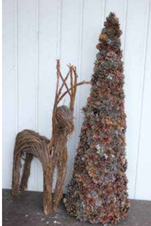
Kuva 1. Risuista ja männynkävyistä saa käsistään kätevä aikaan monenmoista

Ympäristötietoisuuden kasvusta huolimatta yritysten hyödyntämät koristemateriaalit ovat enimmäkseen ulkomaista alkuperää ja vain pieni osa Suomessa käytetyistä käsityö- ja koristemateriaaleista on lähtöisin Suomen luonnosta. Kotimaista raaka-ainetta ovat yleisimmin jäkälät, varvut sekä sammal, josta suurin osa tulee kotimaasta. Useimmat suomalaiset varvut sopivat koristekäyttöön, ja esimerkiksi kanervaa, puolukkaa,