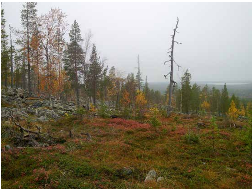
Kuva 7. Monilla kotimaisilla varpukasveilla on hieno ruskaväritys

Erikoismuotoja lisätään tavallisesti kasvullisesti esim. pistokaslisäyksellä, varttamalla tai mikrolisäyksellä. Monia kasvien erikoismuotoja tunnetaan viljelylajikkeina. Lajike on tavallisesti yhtä kloonista eli peräisin yhdestä ainoasta yksilöstä. Oulun yliopiston kasvitieteelliseen puutarhaan on sijoitettu POHKAS-rekisteri (POHjoisen kestävä KASvit), johon on kerätty kestäviä puuvartisista kasveja pääosin Oulun läänin alueelta. Kasvitieteellisestä puutarhasta on vuoden 1990 jälkeen toimitettu taimistoille myyntiin noin 60 kantaa, joista tunnetuin lienee Ylikiimingistä löydetty punakoivu. Uusia mielenkiintoisia kotimaisia kasveja viherrakentamiseen löytynee vielä lisää kasvitieteellisten puutarhojen, puistojen ja arboretumien kokoelmista. Eniten niitä ehkä on odotettavissa