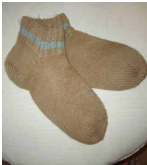
Kuva 4. Esimerkiksi kuusenkäpyjä voi käyttää vaikkapa villasukkien värjäykseen