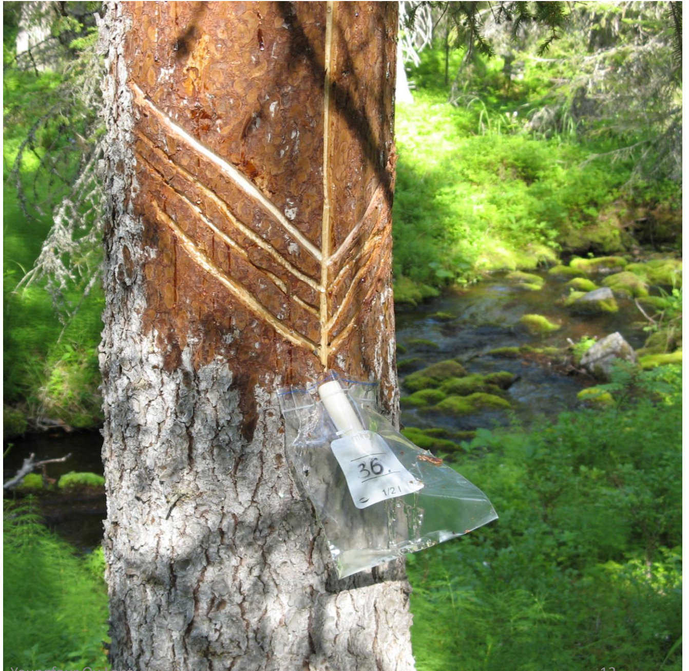
Eija Vuorela Youngfour Oy Lanti 7.2.2018