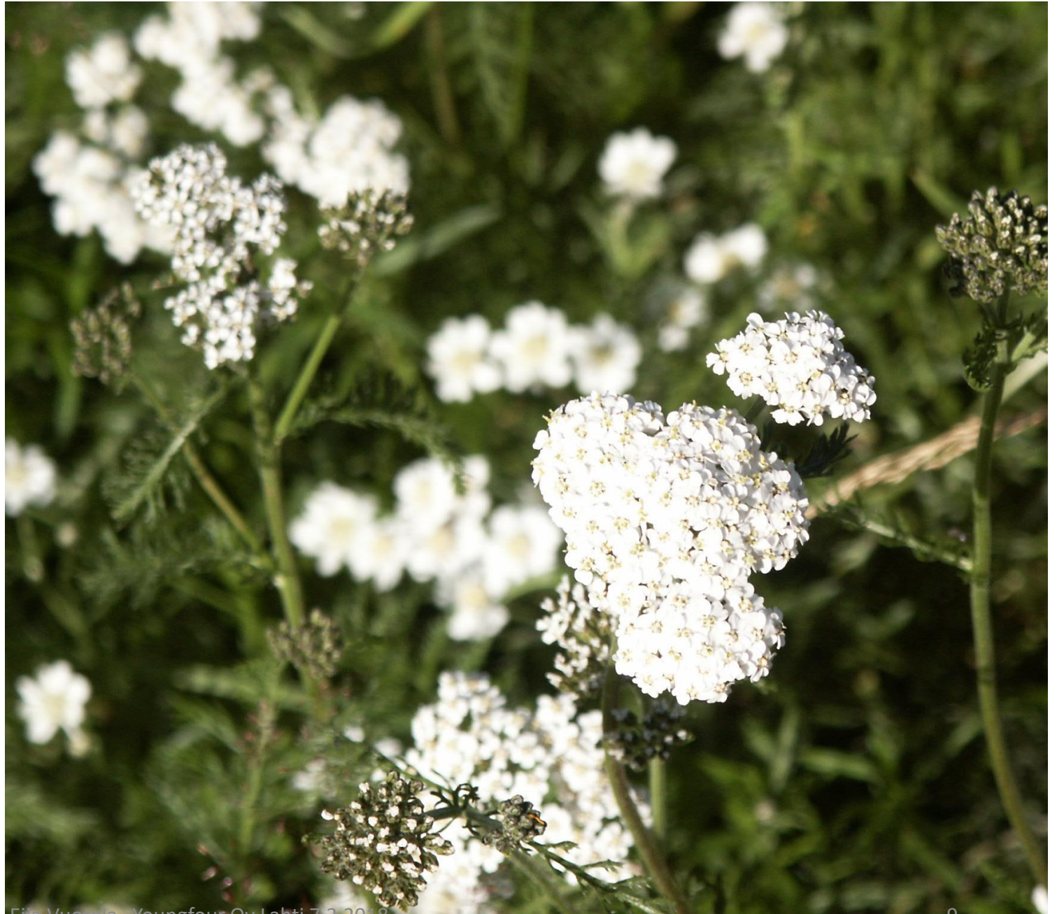
Eija Vuorela - Youngfour Oy Lahiti 7.2.2018